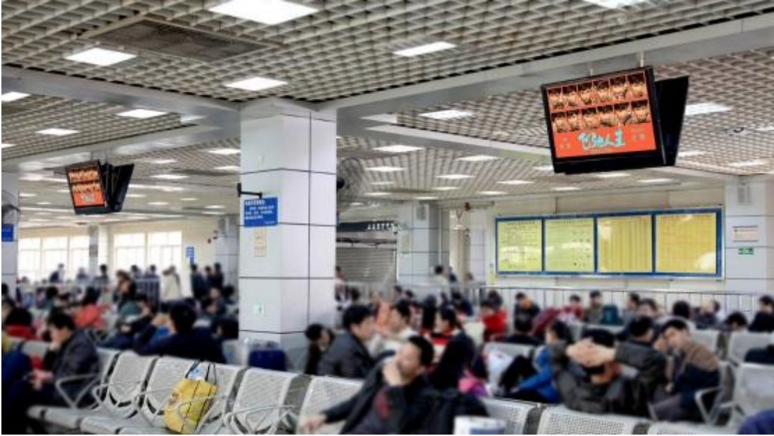
一体机广告（由一个电视视频机和一个数码刷屏机组成）